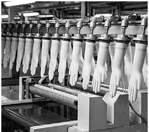
Перчатки теперь будут делать из отечественного сырья.