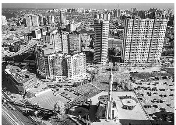
Место для будущего планетария нашли знаковое — рядом с настоящей ракетой-носителем.

Планетарий соединят со зданием музея «Самарская космическая», в комплексе которого входит ракета-носитель «Союз» — ее выпускают на самарском предприятии РКЦ «Прогресс». Это не муляж и не скульптура — монумент представляет собой настоящую вертикально смонтированную ракету-носитель, родную «сестру» тех, которые до сих пор выводят космические корабли на орбиту Земли. ●